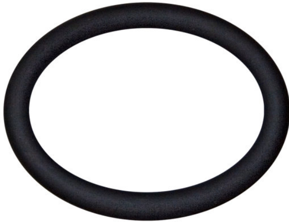
O-Ring FKM, DN 630 ISO-K