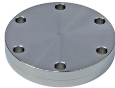
Blindflansch, Edelstahl 304L, DN 63 CF