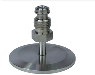
VCR-Adapter, male, G 1/2", DN 40 ISO-KF